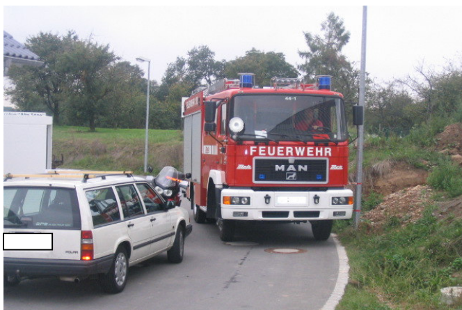
Baugebiet Alte Säge

Denken Sie daran, nur wo Busse oder Müllwagen durchkommen, haben wir die Chance, auch Ihnen zu helfen!